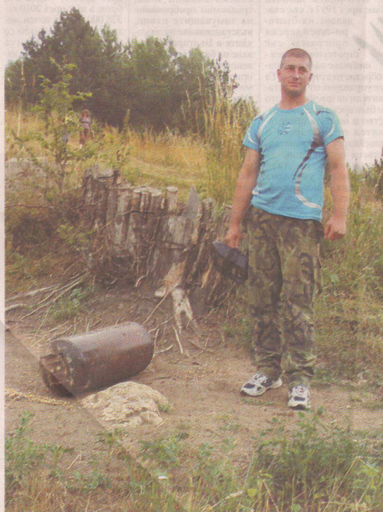
Заим показва хранилка примка за мечки

Пътят за получаване на компенсация в момента започва от подаване на жалба в Главна дирекция по горите, в която се описва какво е станало. Директорът на горското ведомство пуска заповед за създаване на комисия, съгласно закона за лова и защита на дивеча. В нея влизат представители на местната власт, на горското стопанство или РДГ, на РИОСВ, ветеринарен лекар. Те огледат на мястото и правят оглед. Установяват дали шетата е от мечка, после дали имат регистрация убитите животни, кога е станало, дали са взети превантивни мерки, подготвя се протокол, в който всичко се описва, и на негова база се прави предложение до МОСВ за обезщетение.