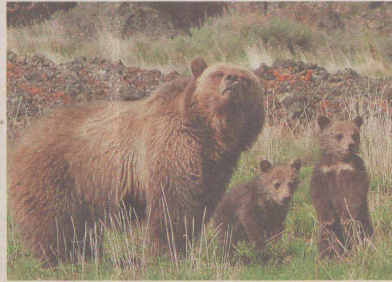
Видът е строго защитен в Ебропа

В същото време е напълно сигурен в интелигентността на животните. През смях се сеща за някой номер, които са му погаждали. Веднъж един тъкмо маркиран и събуждащ се от упойка мечок замалко не разбил колата му, дерейки сърдито резервната гума. Дуцов бил принуден да наблюдава откъмъшението от разстояние, скрит между дърветата.