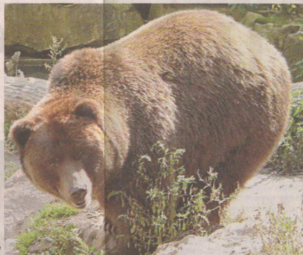
Лакомница от Родопите

Първата мечка, на която сложили GPS нашийник, се казвала Чара, защото била много чаровна мажка, разказват зоолозите. Дамиян пък бил младо едногодишно мече, което извадил от браконьерска примка в Южна Витоша. Руси уловили над хижа „Русалка“ в Стара планина. В Триград сложили нашийник с GPS-