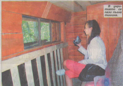
В укритието се пази пълна тишина.

На 30-ина километра от Девин е Пещерата на мечките. Пътуването става само с вископроходим автомобил, след което по тясна пътека след 15 минути изкачване се стига до самата пещера. Тя е била убежище на пещерна мечка (Ursus spelaeus), живяла преди 14 000 години. Вътре са открити 20 черепа, много зъби, а също и останки от