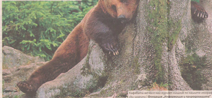
Кафявата мечка е най-егривият хищник по нашите географски ширини